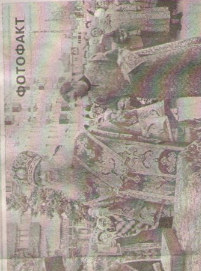
Ж ДОСТАВЛЕН БЛАГОДАТНЫЙ ОГОНЬ реля у арки в честь Урюпинской иконы Божией Матери, Большая Великая вечерня. Служения в Урюпинске был доставлен Благодатный огонь, которую субботу в храме Гроба Господня в Иерусалиме.

школа № 4. Деlegates приняли участие в мастер-классах, круглых столах, тренингах, семинарах, на которых рассматривались актуальные вопросы, связанные с технологией подачи информации, обучения с учетом индивидуальных особенностей учащихся, профориентацией, патриотическим воспитанием. Выставка, представленная образовательными учреждениями города, вызвала интерес у участников форума. С мероприятиями делегаты вернулись с наградами. В номинации «Социальное партнерство как условие обеспечения современного качества образования, предпрофессиональной подготовки обучающихся» средняя школа № 6 и учебный центр завоевали дипломы первой степени, а средняя школа № 4 — диплом третьей степени. М. РЯБЦЕВА.