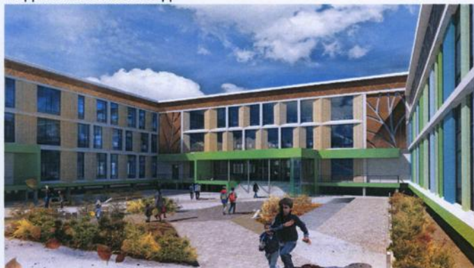
Вид на главный вход