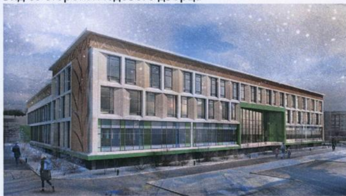
Вид со стороны Ледового дворца