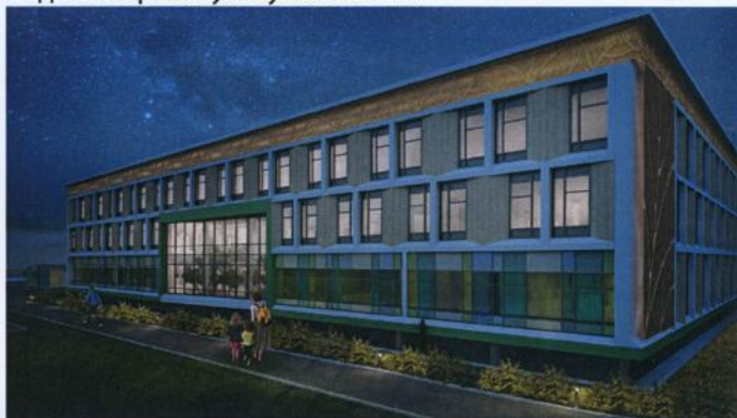
Вид со стороны ул. Рультытегина