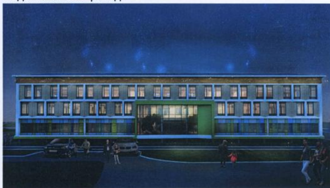
Вид на южный фасад