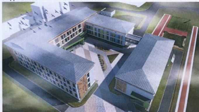
Вид с высоты птичьего полета