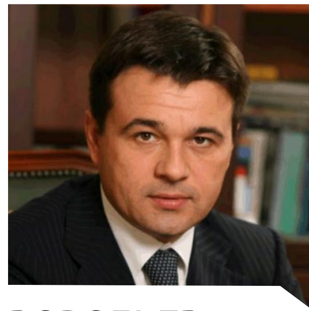
ВОРОБЬЕВ Андрей Юрьевич

Член Бюро Высшего совета Партии, губернатор Московской области